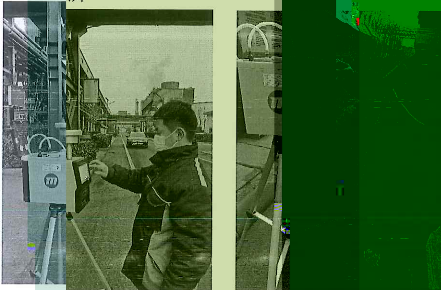
附件 3: 现场采样照片